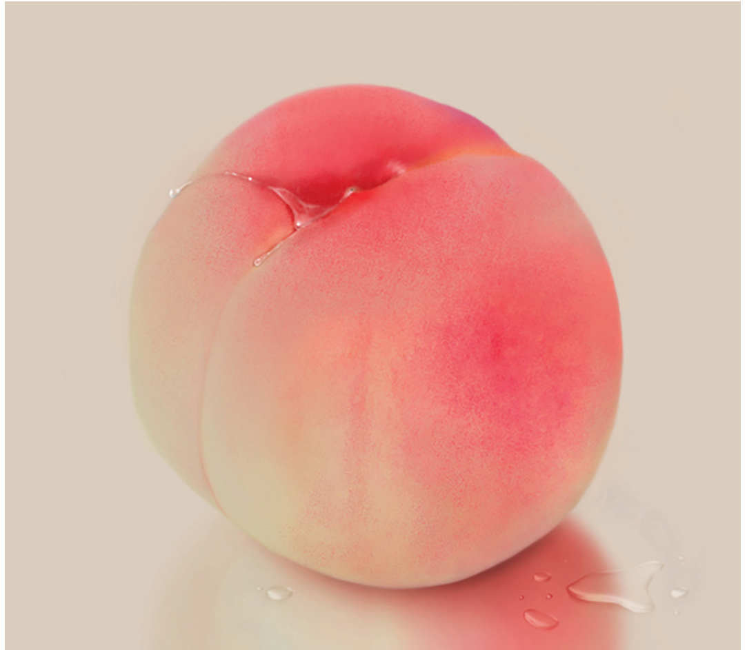
Lee Lee-Nam, Peach - 2008