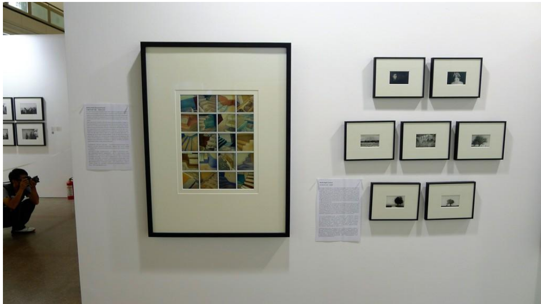
Photo 12 Galerie 展览会布置

士惊讶于华夏土地上有如此多的人热爱摄影。如今到第三个年头，影像上海愈发的专业与有序，就这次而言，三天博览会，三大主要板块以及藏家与公众的分流看展，都让这次博览会更加专业，也让来访的观众更具体验感。