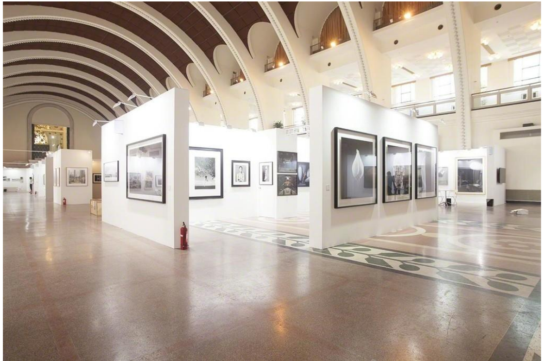
2016 影像上海艺术博览会现场

从 2014 年首届影像上海艺术博览会举办至今，三届博览会，德斯坦女士及其画廊从未有过缺席。当问及她为何能坚持每年都来赴约时，她笑着说：“因为这儿真的很棒！”