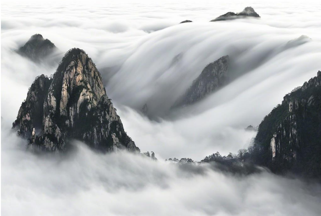
《黄山瀑布》 蒂埃里·伯尼尔 96 × 160cm Edition 8/8 + 2AP

在画廊现场，首先映入我们眼帘的便属这幅类似中国梯田的作品，一问之下，果不其然。这幅作品名叫《元阳梯田》，是法国摄影家蒂埃里在中国南方拍摄的，并于 2010 年刊登在美国国家地理杂志上。由于对于摄影的热情，蒂埃里毅然决然地辞去 8 年的 CFO 工作，当他发现中国西南地区的美丽风景时，便在云南落了脚。