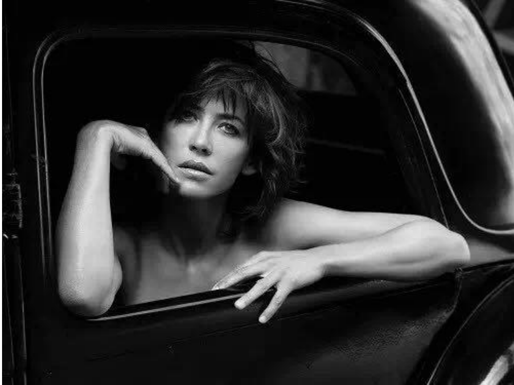
《苏菲·玛索》施密德 60 x 80cm 巴黎 2011年

而施密德长期与明星合作，凯瑟琳·德纳芙、黛安·克鲁格、苏菲·玛索、蕾雅·瑟杜、欧嘉·柯瑞兰寇、杰瑞米·艾恩斯都是他镜头下的主角。