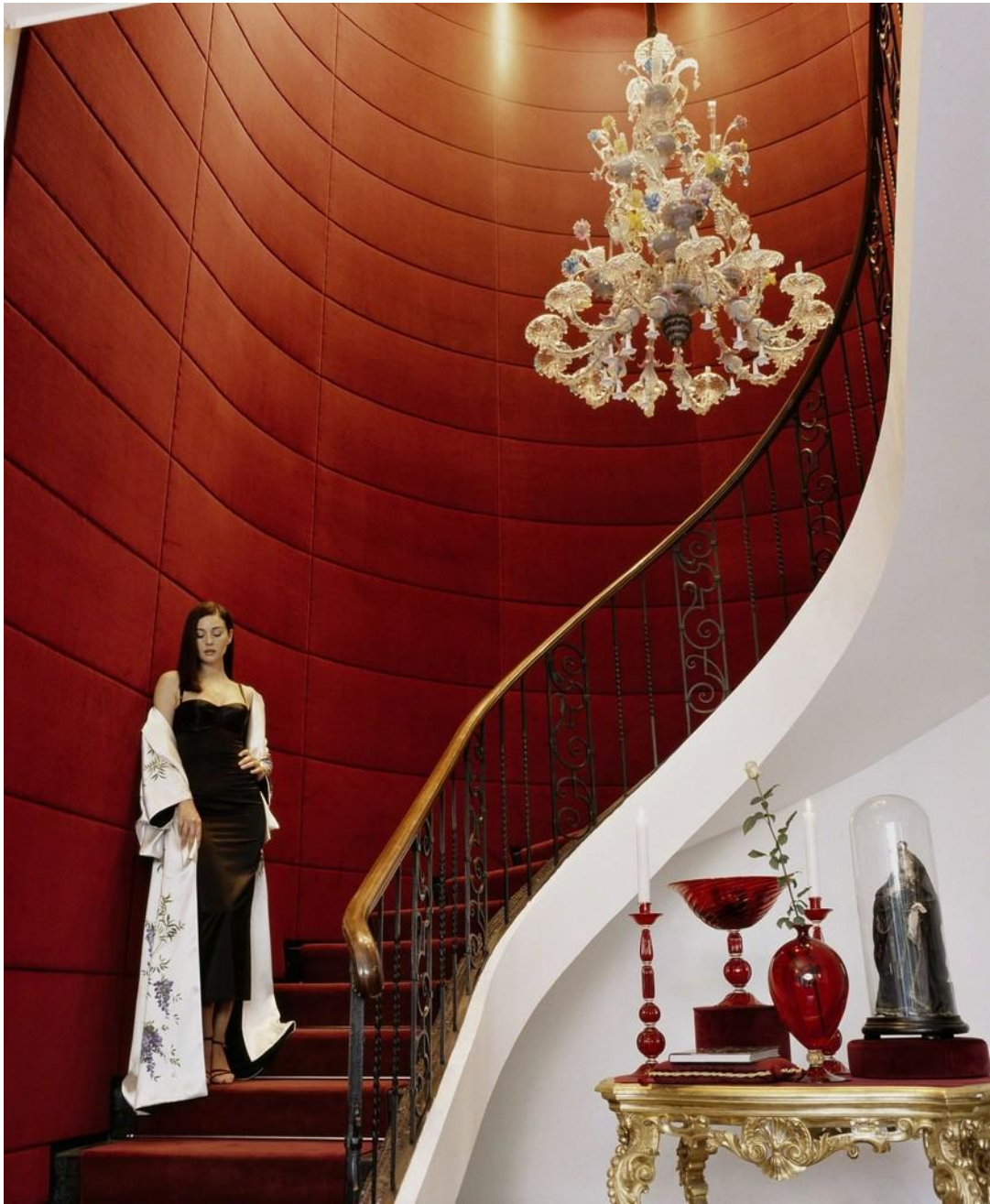
《莫妮卡·贝鲁奇身着杜嘉班纳》 佩里耶 80x60cm 1998 年

除了马修·贝林, 让-玛丽·佩里耶和洛塔尔·施密德同样是时尚摄影的佼佼者。两位在与 ELLE、Vogue 等时尚杂志合作的同时, 也在其他项目上取得巨大成功。佩里耶拍摄了一系列电视纪录片。2008 年, 他和法国著名歌手雅克·迪特隆为法国电视台“巴黎首映”执导了 50 部短片, 还为法国 5 台执导了 50 部关于 60 年代的短片。