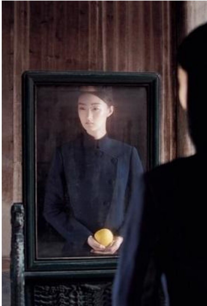
《西递村》 马修·贝林 80 x 53cm 安徽 2012年

在马修看来摄影以及图像处理能让他更好地了解周围的人和世界。他认为拍摄照片的每一个元素都是极为重要的，光线、时间和想法都是相互依赖的。马修相信自己会永远都被各种奥妙的图像形式以及它们揭示的惊人秘密所吸引。