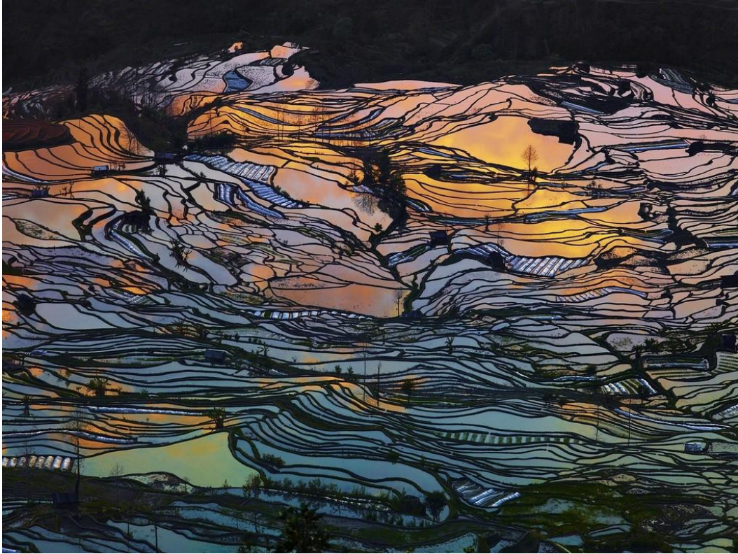
《元阳梯田》 蒂埃里·伯尼尔 80 × 120cm Edition 8/8 + 2AP

在画廊现场，首先映入我们眼帘的便属这幅类似中国梯田的作品，一问之下，果不其然。这幅作品名叫《元阳梯田》，是法国摄影家蒂埃里在中国南方拍摄的，并于 2010 年刊登在美国国家地理杂志上。由于对于摄影的热情，蒂埃里毅然决然地辞去 8 年的 CFO 工作，当他发现中国西南地区的美丽风景时，便在云南落了脚。