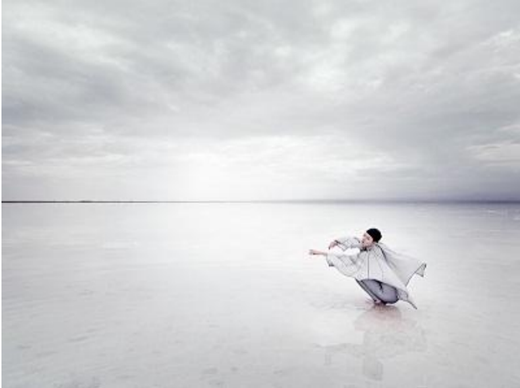
《茶卡盐湖》 马修·贝林 80 × 106cm 青海 2012年

为了能拍出最佳的作品，蒂埃里爬上过许多最高点，在那里所有的景色尽收眼底，他会等待很长时间以获得最理想的摄影光线。捕捉人、时尚、大自然或风景的各种美需要不同的方式，很具有挑战性，但如果你爱自己的工作，那你将永远不会停止学习。