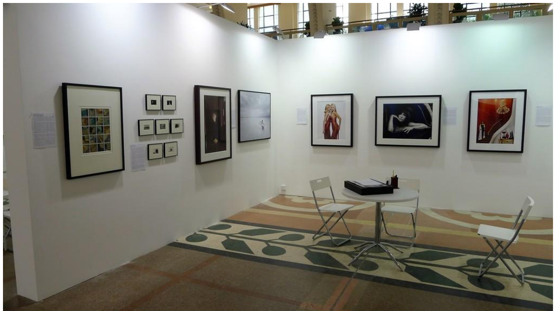
Photo 12 Galerie 展览会布置

确实，从 2014 年举办开始，影像上海艺术博览会迅速确立了其作为中国大陆顶级国际艺术博览会的地位，促进着中国和泛亚地区起步相对较晚的摄影收藏市场的发展。而对于 Photo 12 Galerie 这类国际画廊，影像上海为其提供进入中国的独特机遇和良好平台，同时也得以让他们在独特的亚太地区进行销售。