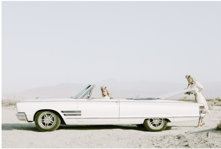
The Trunk – série Darlene and me 2014 © Anja Niemi