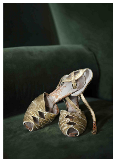
De haut en bas Scarlett Her Shoes