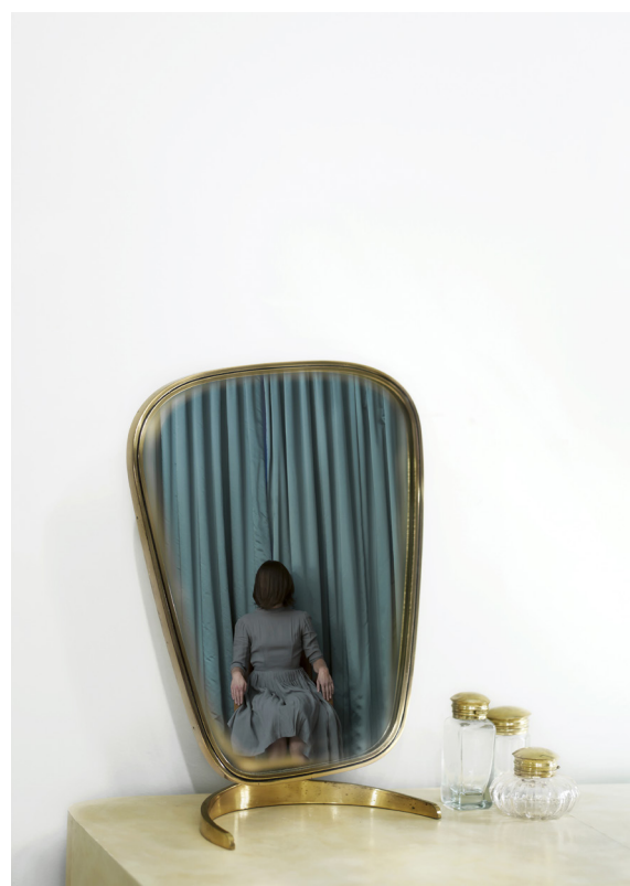
Room 39 (vanity) – série Do not Disturb © Anja Niemi

Sera exposée dans l'Espace du 10 une sélection de ses précédentes séries : Darlene and me (2014), Starlets (2014), Do Not Disturb (2013)