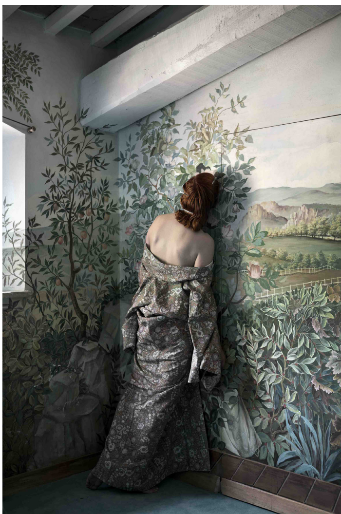
Photo12 Galerie présente en exclusivité en France la nouvelle série de la photographe Anja Niemi

VERNISSAGE JEUDI 16 MARS À PARTIR DE 18H