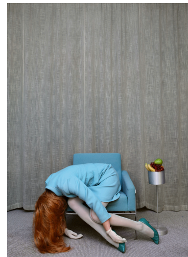
The Secretary – série Starlets 2013