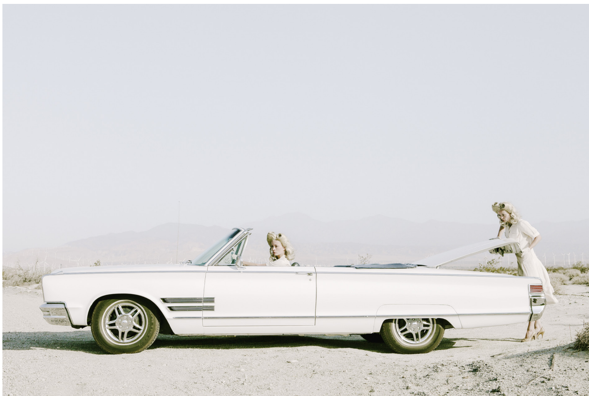
The Trunk – série Darlene and me © Anja Niemi

Dans Do Not Disturb , c'est le miroir qui apparaît comme le filigrane de la série, dans Darlene and me , la sœur jumelle qui tente d'éliminer sa rivale. À chaque fois ces personnages paraissent désœuvrés, en profonde contradiction avec eux-mêmes.