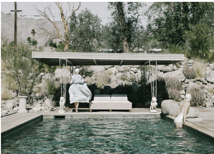
The Swimming – série Darlene and me 2014 © Anja Niemi