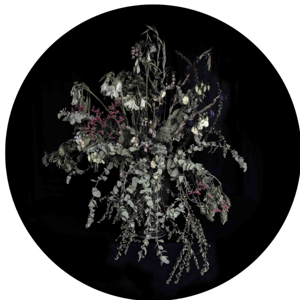
The Woman Who Never Existed