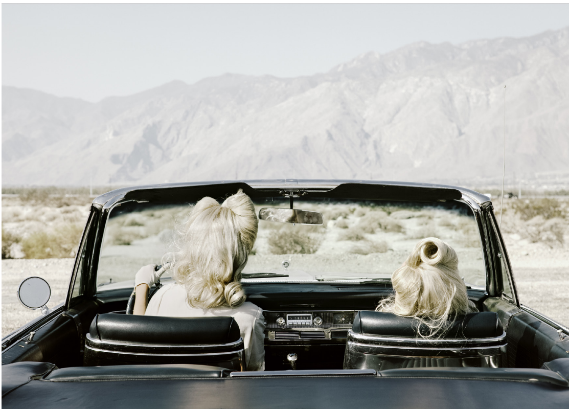
The Chrysler – série Darlene and me © Anja Niemi