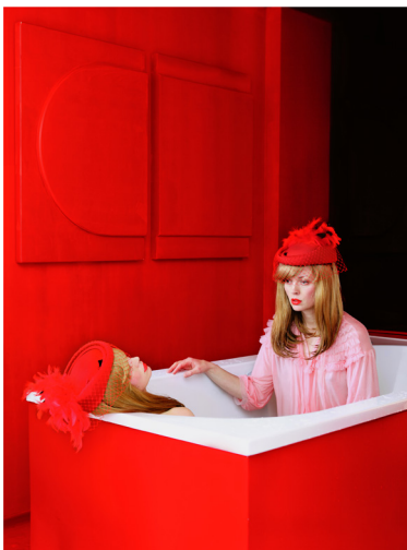
The Socialite – série Starlets 2013