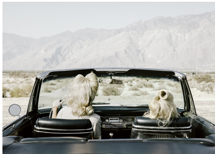
The Chrysler – série Darlene and me 2014 © Anja Niemi