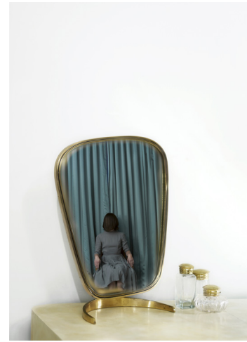
Room 39 (vanity) – série Do not Disturb 2011 © Anja Niemi