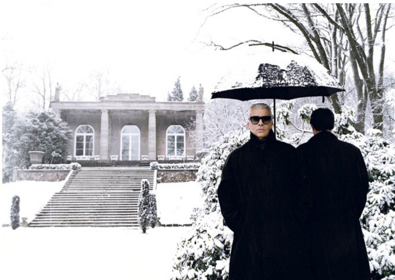
Karl Lagerfeld, Hambourg, mai 1995

«Karl Lagerfeld dans le château qu'il possédait à l'époque à Hambourg. Karl est un homme étrange, qui transforme ses plaisirs en travail et son travail en passion. Mélange de courtoisie et de rigueur, il maîtrise plusieurs vies parallèles dont je connais pas le nombre.»