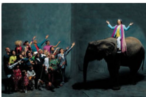
Kenzo éléphant, Paris, 1992