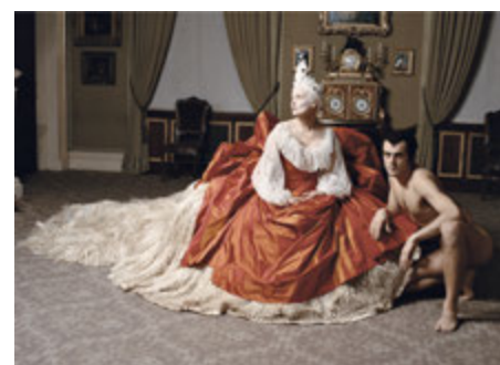
Vivienne Westwood, Londres, Septembre 1994

Du 22 mars au 12 mai 2018, Photo12 Galerie présente «Fashion Galaxy », une exposition de photographies largement inédites de Jean-Marie Périer